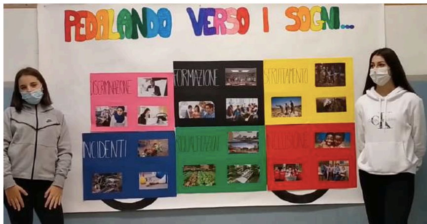
Video e cartellone realizzati dalla 3 ^ M IC di Via Linneo – Plesso Mameli

Buono valido per INCONTRO E LABORATORIO con