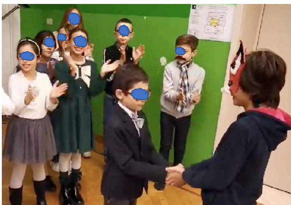
Video realizzato dalla 4 ^ e 5 ^ Scuola Elementare Maria Consolatrice